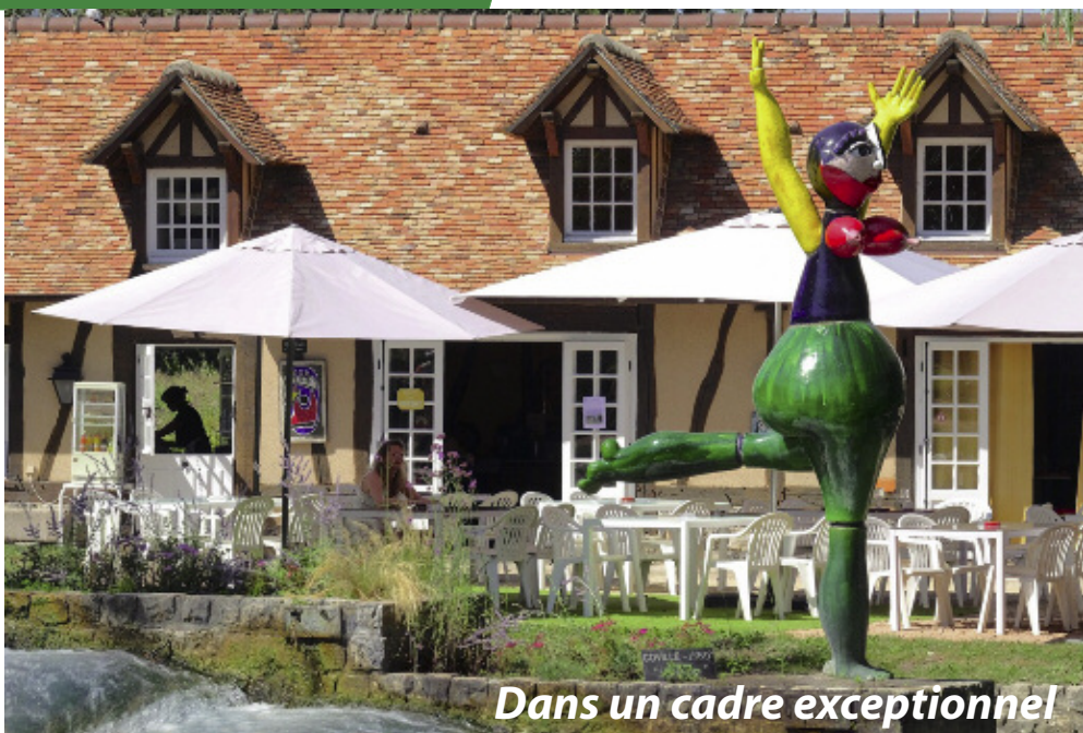
Dans un cadre exceptionnel