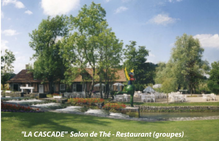
"LA CASCADE" Salon de Thé - Restaurant (groupes)

Expositions temporaires de peinture et sculpture au Château, au Colombier et à la Galerie. Manifestations ponctuelles. (programme annuel sur demande ou sur internet)